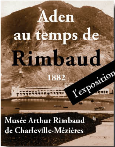
l'exposition à Charleville