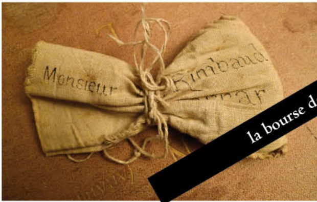
la bourse de Rimbaud