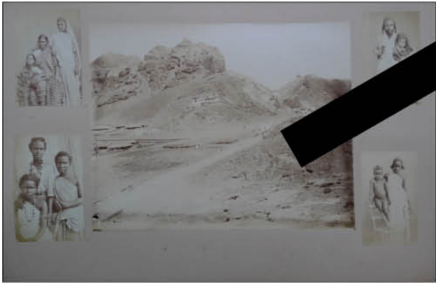
70 photos inédites