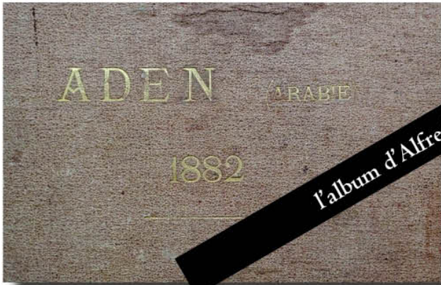
l'album d'Alfred Bardey