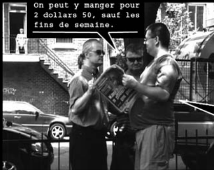
On peut y manger pour 2 dollars 50, sauf les fins de semaine.

Les gens du quartier viennent y manger pas cher, et aussi rencontrer du monde.