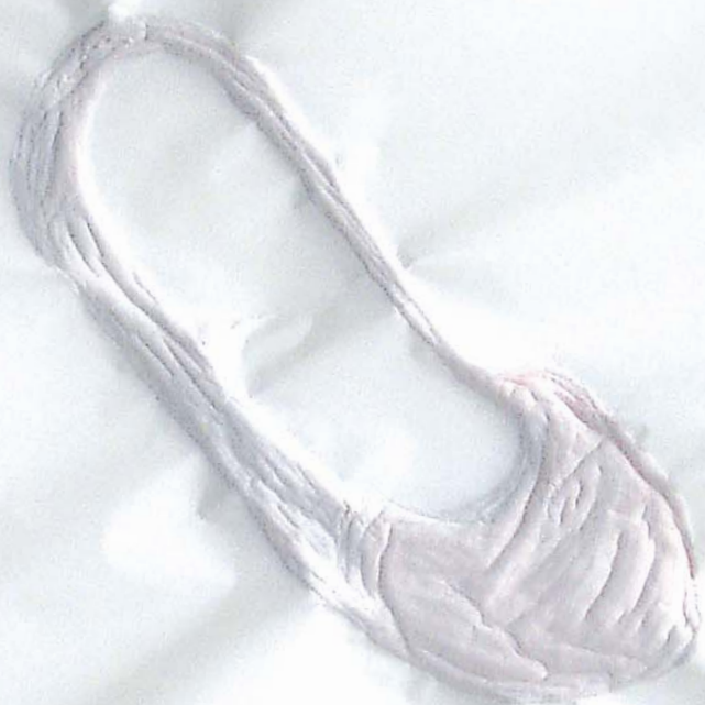
Une mule, à la hauteur du Leader Price, autoroute pour Chambéry, lundi 24 mai 2004.