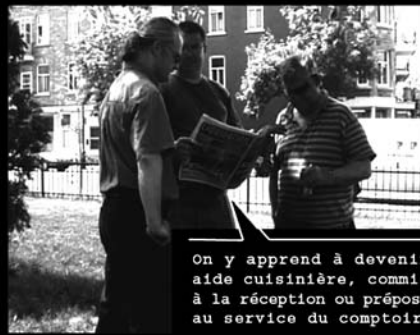
On y apprend à devenir aide cuisinière, commis à la réception ou préposé au service du comptoir.

Le Resto Pop, c'est un organisme communautaire, un restaurant et un lieu de formation.