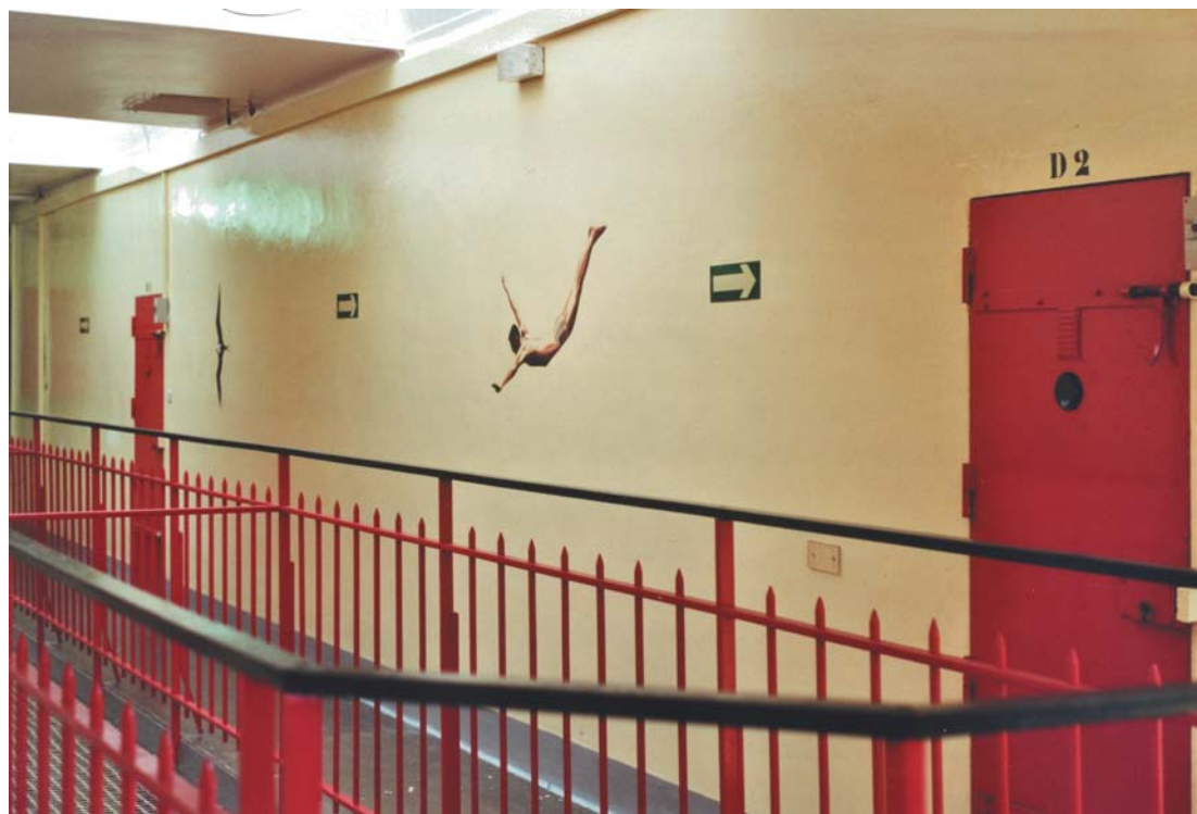
Saut de l'ange. Vue d'ensemble, deuxième étage de la détention.