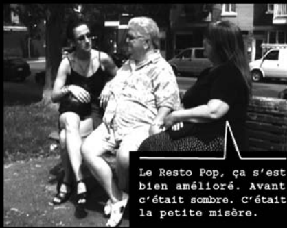
Le Resto Pop, ça s'est bien amélioré. Avant c'était sombre. C'était la petite misère.

Les gens du quartier viennent y manger pas cher, et aussi rencontrer du monde.