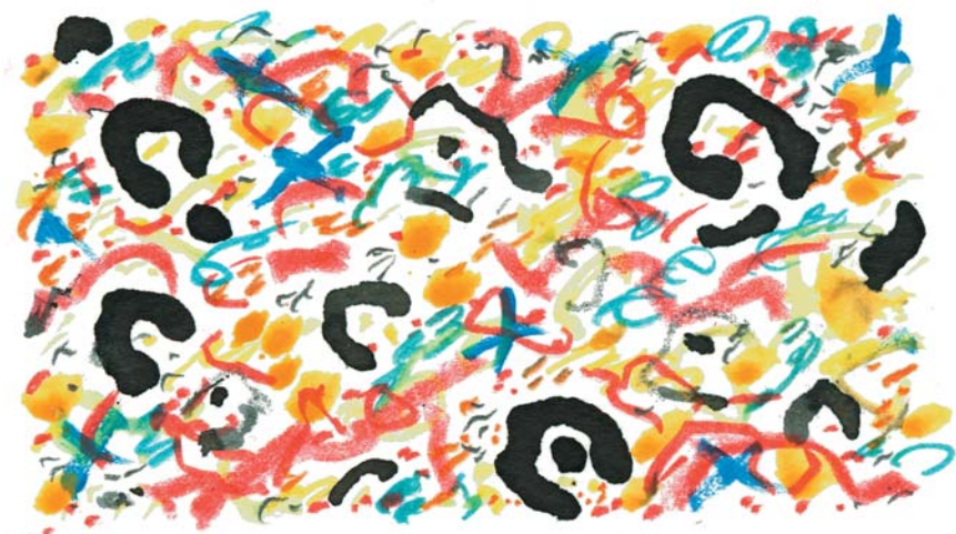
F. Cælebs, 27.08.05

D'autant qu'il y a eu une autre lueur, née d'une carte en couleurs envoyée par Cælebs, resté lui là-bas pour une durée indéterminée (Cælebs, comme B., a le chic pour décrocher des CDI qui enjambent siècles et continents