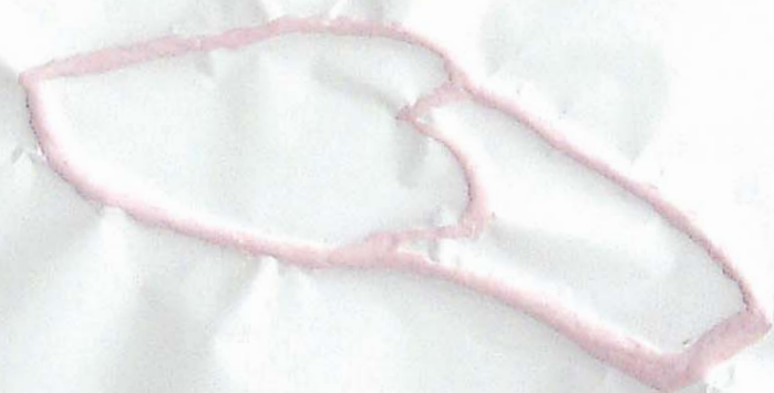
Paris ligne 3, une mule au pied d'un strapontin, jeudi 17 mars 2004.