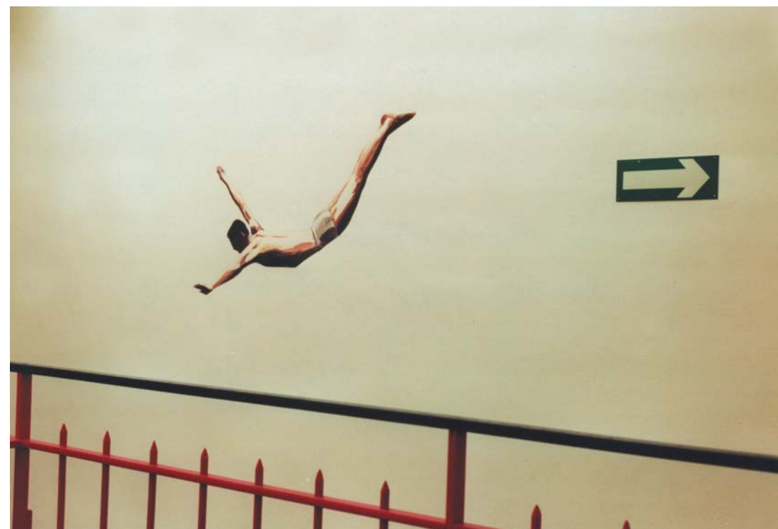
Saut de l'ange. Maison d'arrêt de Saint-Malo, 2000.