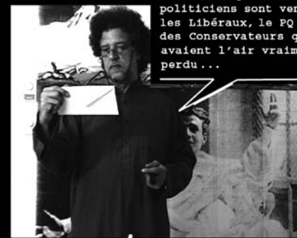
Au Resto Pop, tous les politiciens sont venus: les Libéraux, le PQ et des Conservateurs qui avaient l'air vraiment perdu...

Des Madames et des Monsieurs viennent même manger ici, avec le char en avant, et toute la famille.