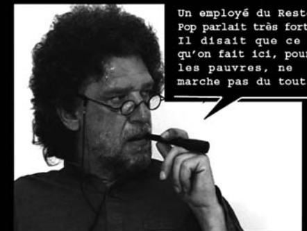
Un employé du Resto Pop parlait très fort. Il disait que ce qu'on fait ici, pour les pauvres, ne marche pas du tout.