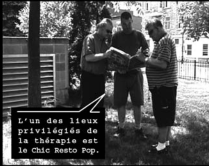
L'un des lieux privilégiés de la thérapie est le Chic Resto Pop.

On y voit défilier, plusieurs fois par an, caméras, micros, et costumes-cravates.